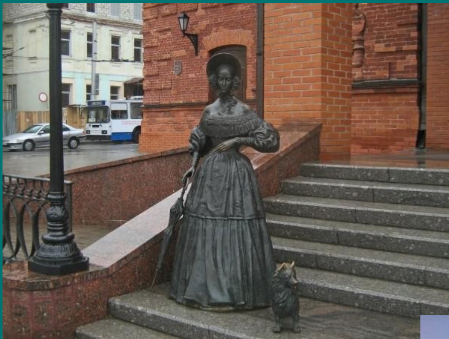
«Дама с собачкой» г. Астрахань, Россия