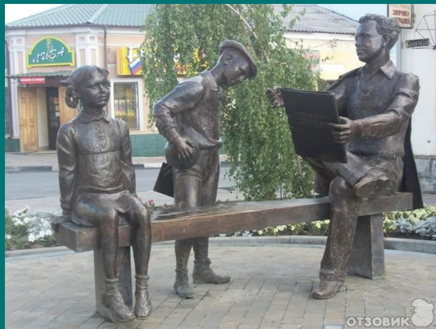
г. Елецк, Липецкая обл., Россия