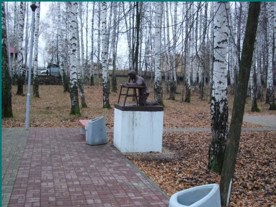
г. Пермь, Россия Парк им. А.П Чехова